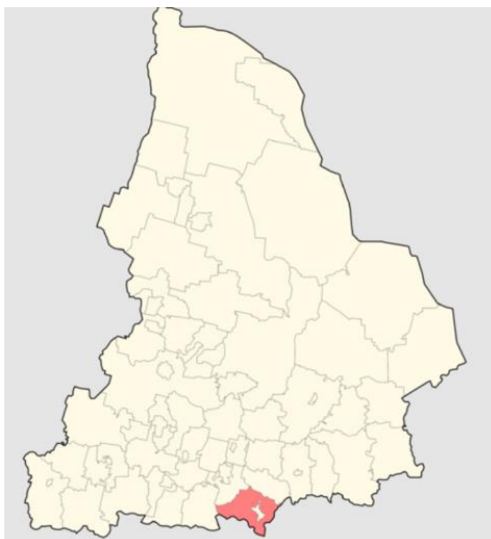
Рисунок 2 – Местоположение МО «Каменский городской округ» на территории Свердловской области

Территория Каменского городского округа расположена в лесостепной зоне. Преобладающие виды деревьев — берёза, осина, сосна. Животный мир представлен в основном лесными видами животных: лось, кабан, косуля, заяц, лисица, горноста́й, куница, барсук, норка, белка; из пернатых — глухарь, тетерев, рябчик, куропатка.